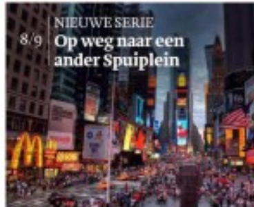
NIEUWE SERIE 8/9 Op weg naar een ander Spuiplein

College barst bijna voor de zoveelste keer