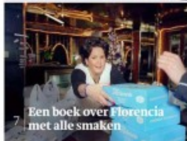
Een boek over Florenzia met alle smaken