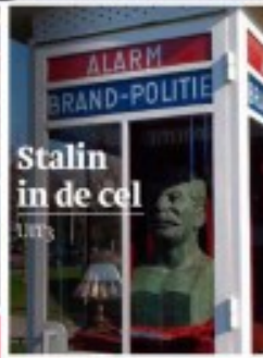
Stalin in de cel

College barst bijna voor de zoveelste keer